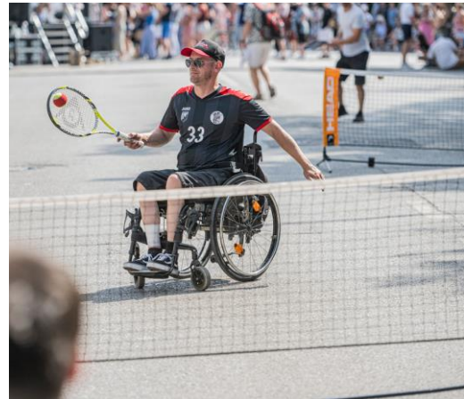
Minga Warrior und Rollstuhl-Tennis – Impressionen aus 2023.

Zehntausende Menschen werden beim kostenfreien Münchner Sportfestival 2024 den Königsplatz in eine bunte Sportstätte verwandeln. Ob Frisbee, Jigger (eine Mischung aus Rugby und Fechten), Airtrack, Bogenschießen, Klettern, Longboard, Schwertkunst, Fußball, Slackline oder auch Inklusions-Sportangebote: Besucher*innen können am Sonntag, 7. Juli, von 10 bis 18 Uhr, mehr als 60 Sportangebote entdecken, erleben und ausprobieren. Veranstalter ist das Referat für Bildung und Sport der Landeshauptstadt München. „Wir freuen uns riesig, dass mehr als 50 Sportvereine und -institutionen aus München und Umgebung gemeinsam mit uns wieder so ein vielseitiges Angebot an traditionellen wie außergewöhnlichen Sportarten auf die Beine gestellt haben und so ein unvergessliches Event für die ganze Familie ermöglichen. Alle, von Jung bis Alt, Sport-Einsteiger*innen, Freizeitsportler*innen und Profis, erwartet ein Tag voller Spaß, Spannung und Action“, zeigt sich Sportreferent Florian Kraus begeistert.